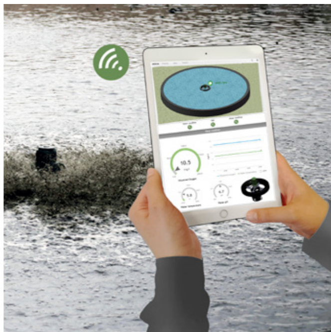
Aireador flotante Roxia pueden conectarse a un Sistema Inteligente de Aeración "Smart Aeration System."