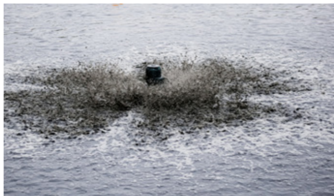
La aireación de aguas residuales no necesita una infraestructura compleja. Aireador flotante Roxia es una solución eficaz y rentable.