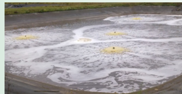
Aireación de lixiviados.